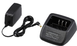
Szybka ładowarka KSC-35S